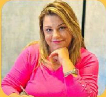
الإشراف البيداغوجي: هاجر بالاغة مساعدة بيداغوجية لغة الانكليزية