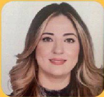
الإشراف البيداغوجي: سلمى الغاوي مساعدة بيداغوجية لغة الانجليزية