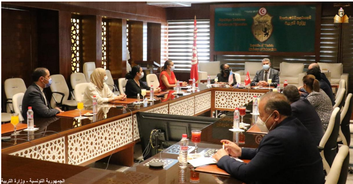
الجمهورية التونسية - وزارة التربية