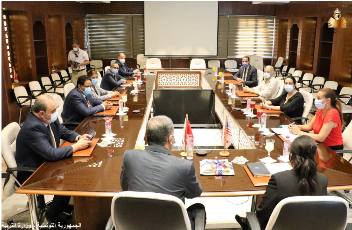
الجمهورية التونسية - وزارة التربية