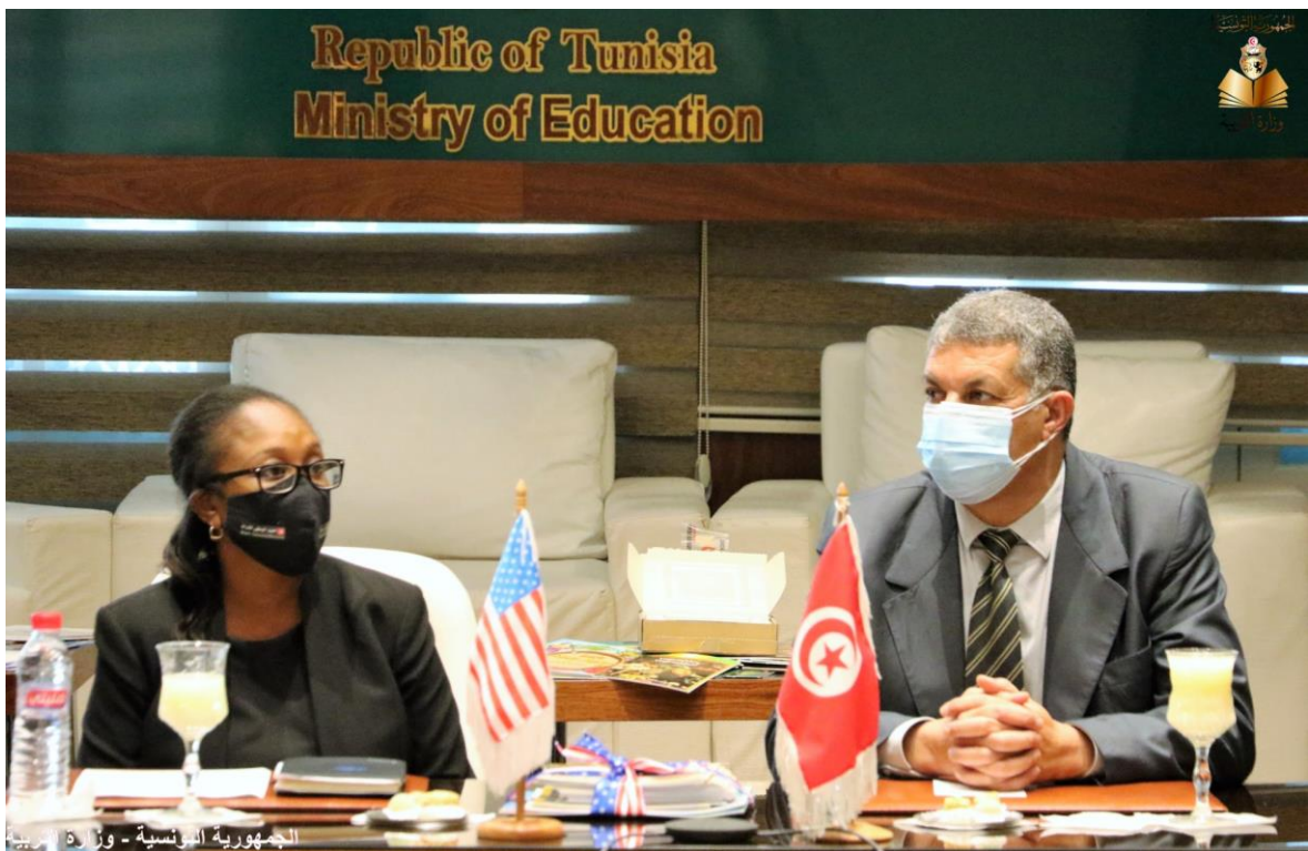
الجمهورية التونسية - وزارة التربية