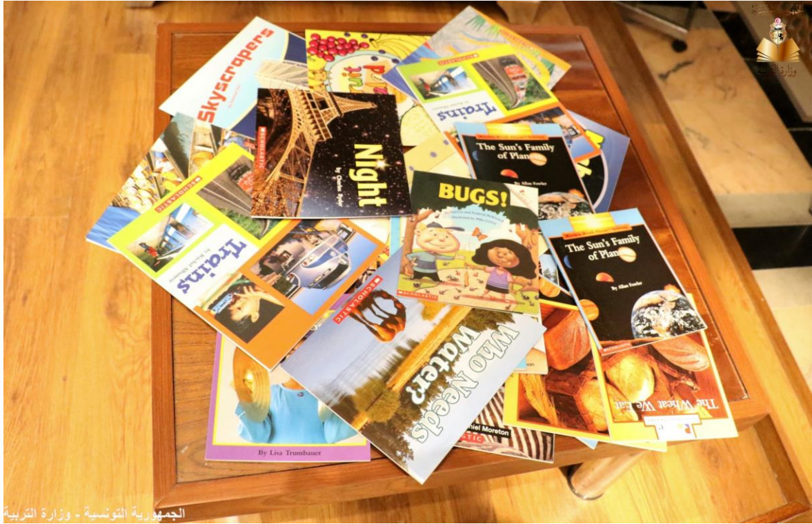
الجمهورية التونسية - وزارة التربية