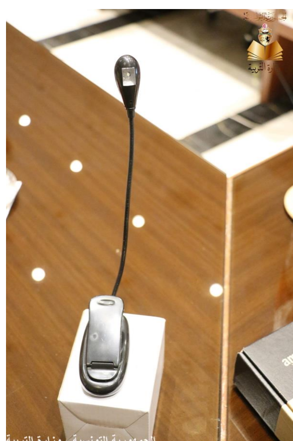
الجمهورية التونسية - وزارة التربية