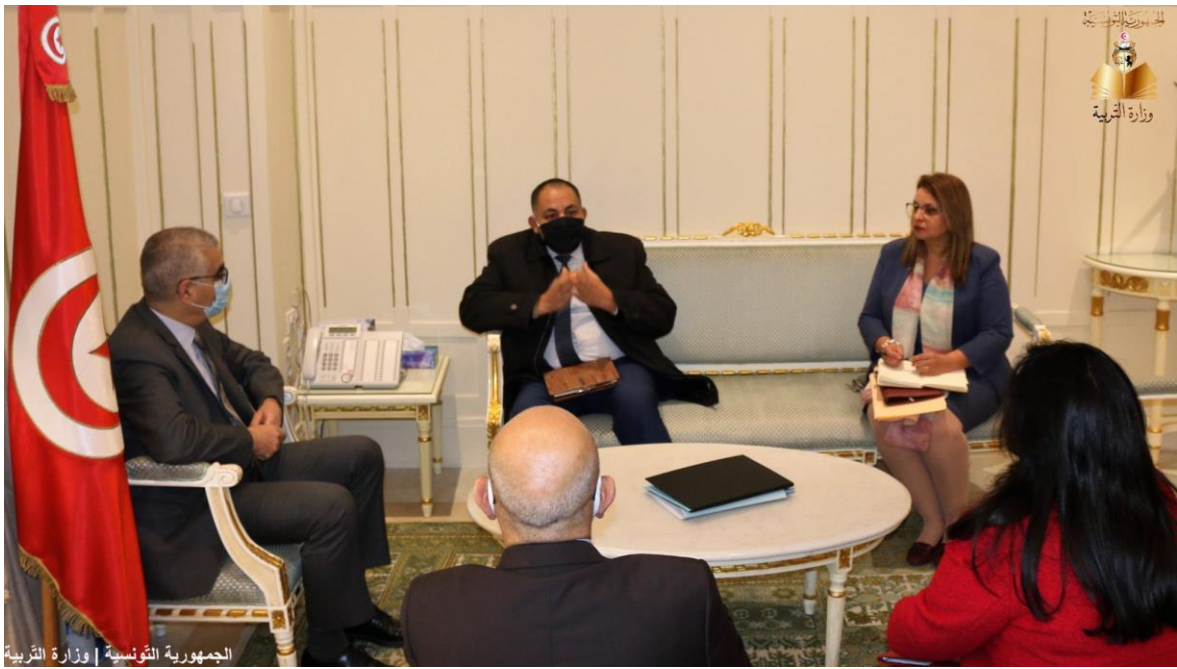
الجمهورية التونسية | وزارة التربية